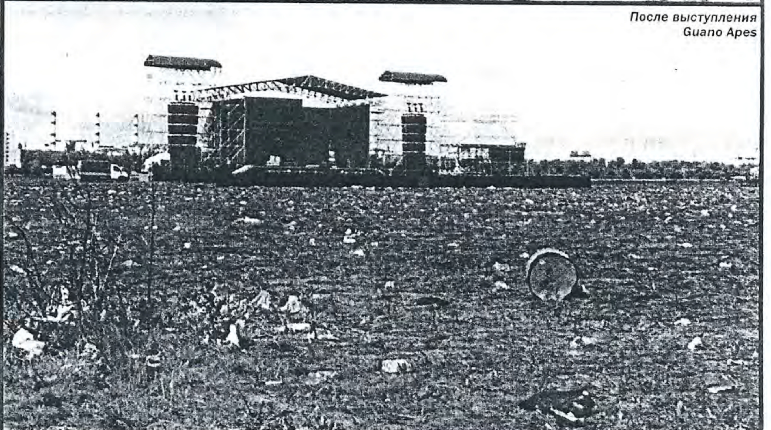
После выступления Guano Apes