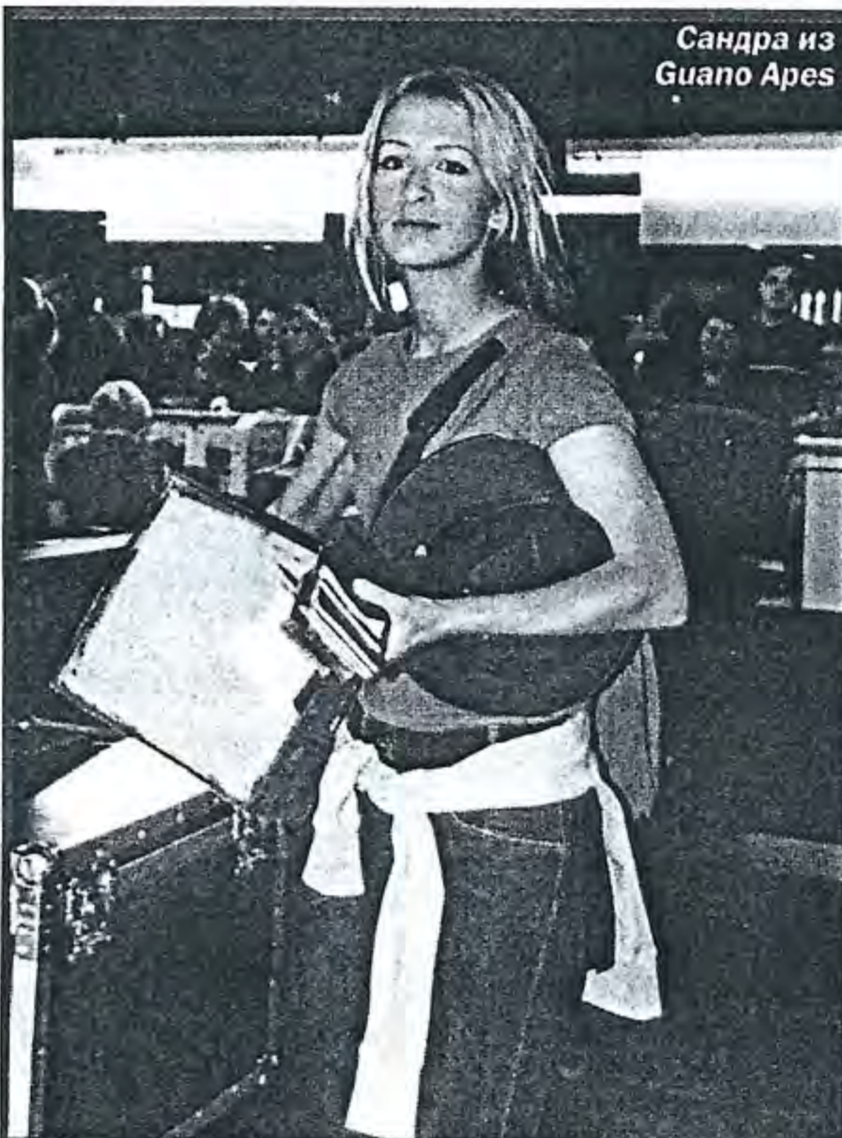
Сандра из Guano Apes

Мы участвовали в техническом обеспечении его концерта. И когда с ним фотографировались, он подошел поблагодарить нас за техническую организацию. Так вот, это совершенно простой человек, в простом свитере и протертых джинсах - без всяких наворотов. И его улыбка, его жесты, когда он руку протянул... - чувствуешь в нем какую-то энергию, духовность. Просто небесный человек. Вообще нам повезло: мы работали с людьми непафосными. Все артисты оказывались нормальными в человеческом плане.