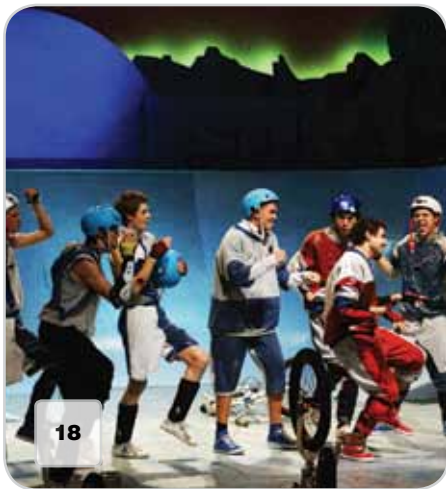
18 Видеопроекция для спектакля «Ромео и Джульетта» в «Сатириконе»