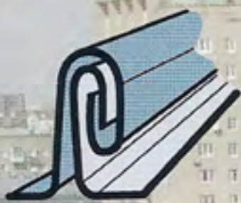
Двойной стоячий фальц