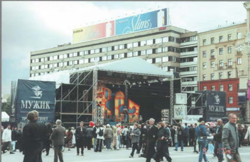
Концертная площадка в рамках празднования Дня Города. Пушкинская площадь.