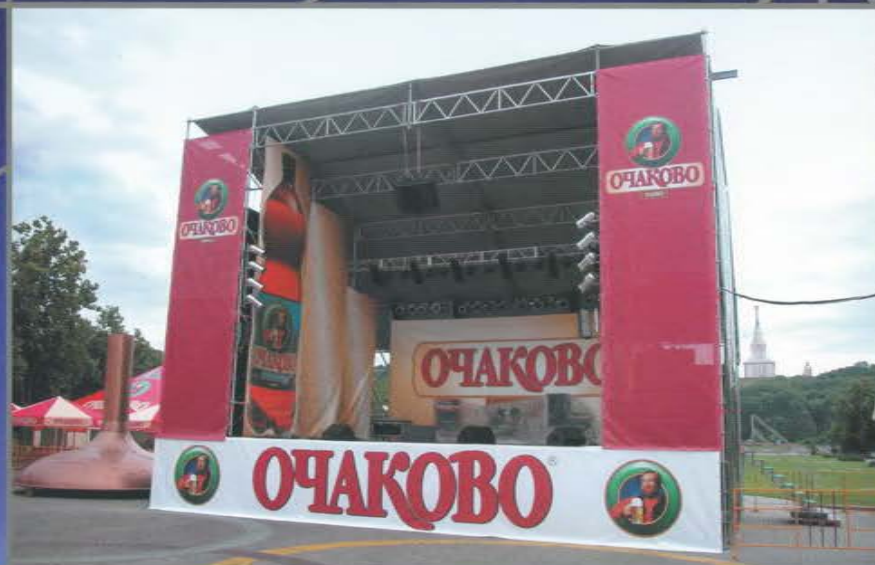
Сцена для акций на площадке пивоваренной компании «Очаково». Шестой Московский Фестиваль Пива. Лужники.