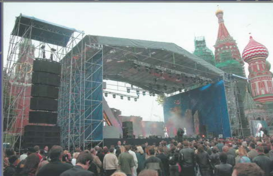
Концерт посвященный открытию Бурейской ГЭС. Васильевский спуск. Красная площадь.