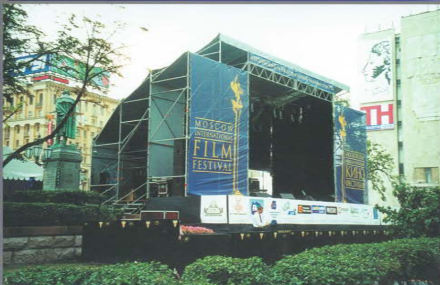
Главная сцена Московского Международного Кинофестиваля. Пушкинская площадь.