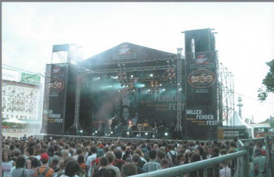
Фестиваль Miller Fender Fest. Болотная площадь.