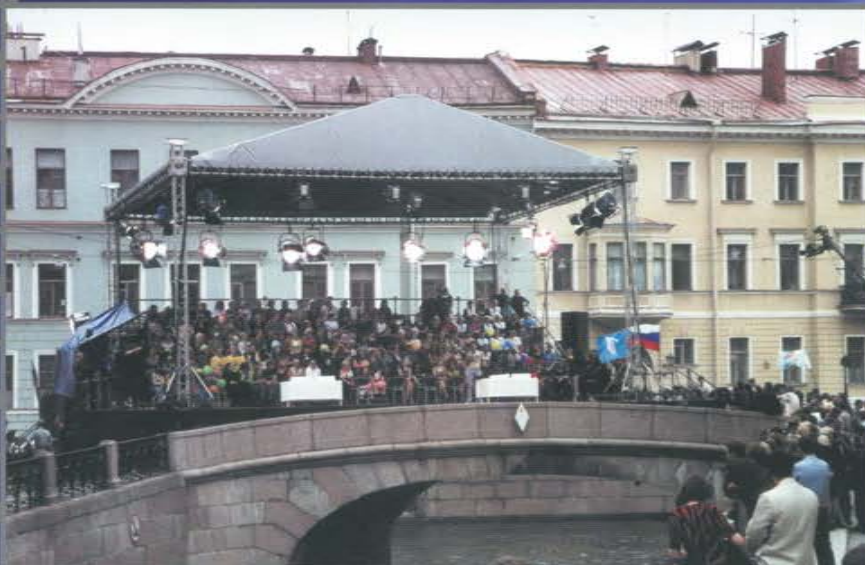
Трибуна для зрителей. Съемка программы «Большая стирка». Мост «Второй Зимний». Санкт-Петербург.