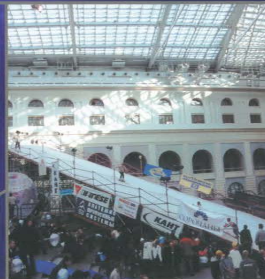
Московский международный лыжный салон. Гостиный Двор.