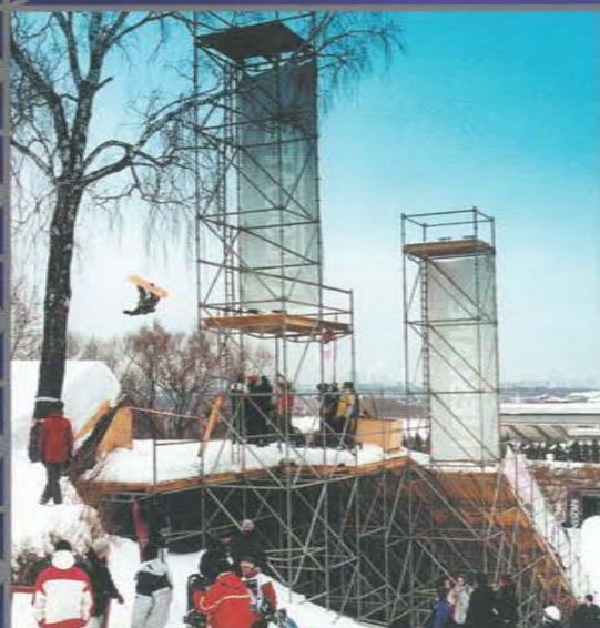
Ежегодный Зимний фестиваль «Чистая энергия Nescafe». Крылатское.