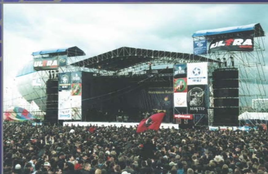
Концерт Guano Apes. Московский международный фестиваль каскадеров «Прометей». Ходынкское поле.