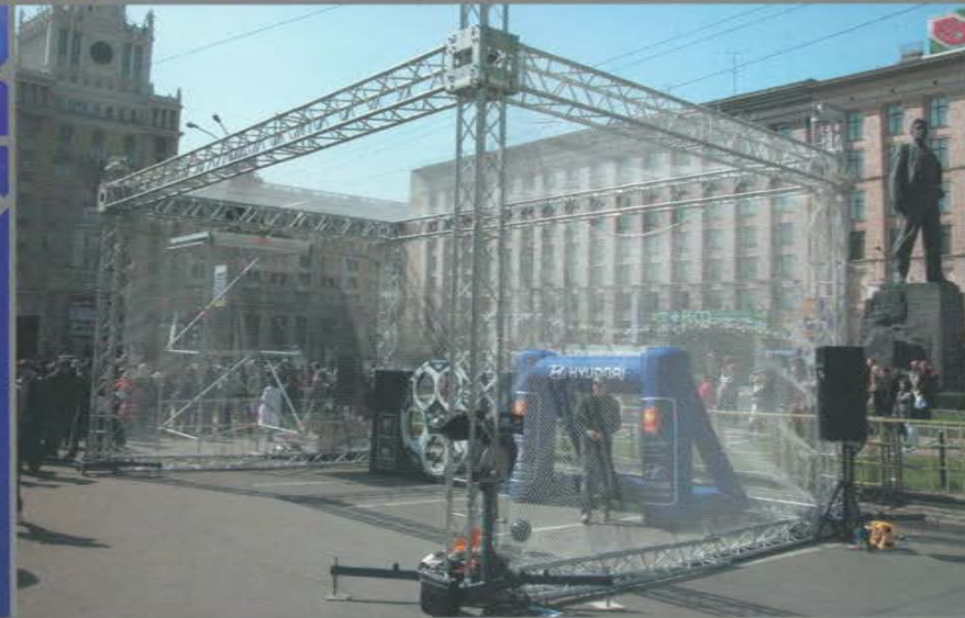
Конструкция, закрытая сеткой, для рекламной акции. Маяковская площадь.