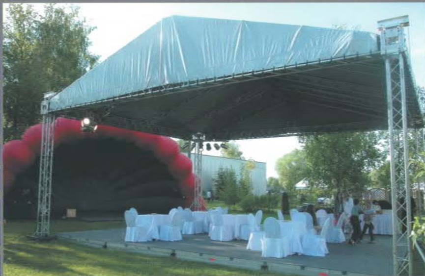
Декоративный навес для загородного мероприятия. Яхт-клуб «Буревестник». Клязьминское водохранилище.