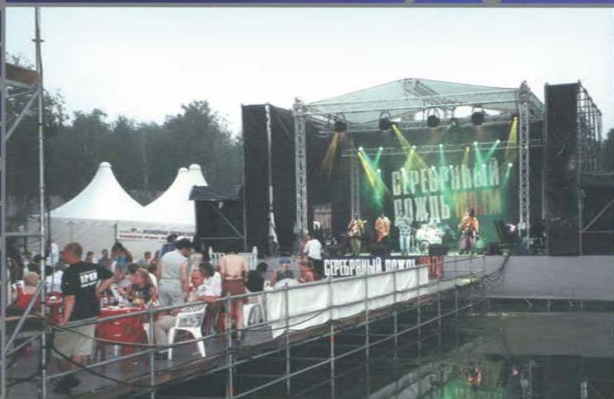
Празднование дня рождения радиостанции «Серебряный Дождь». Гольф-клуб «Moscow Country Club». Нахабино.