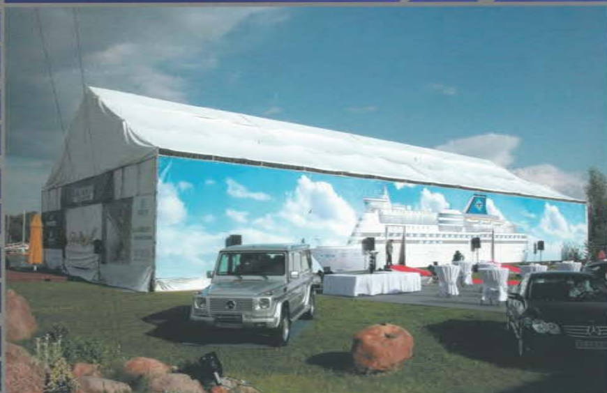
Павильон для открытия летнего сезона в яхт-клубе. Размер 21 x 42 м. Вместимость более 1000 человек. Яхт-клуб «Буревестник». Клязьминское водохранилище.