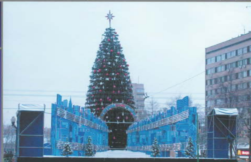
Концертная площадка в рамках празднования Нового года. Пушкинская площадь.