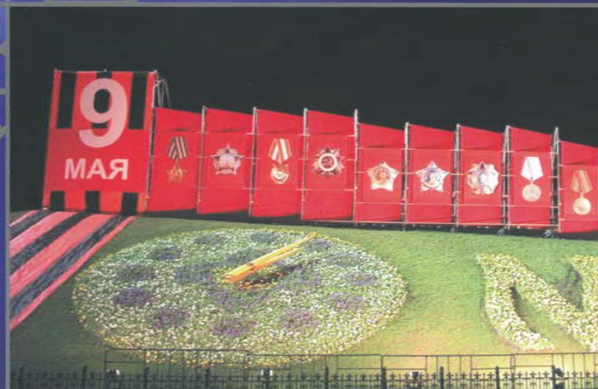
Конструкция для декорации. Поклонная гора.