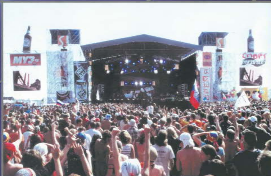
Ежегодный фестиваль «Нашествие». Поселок Эммаус. Тверская область.