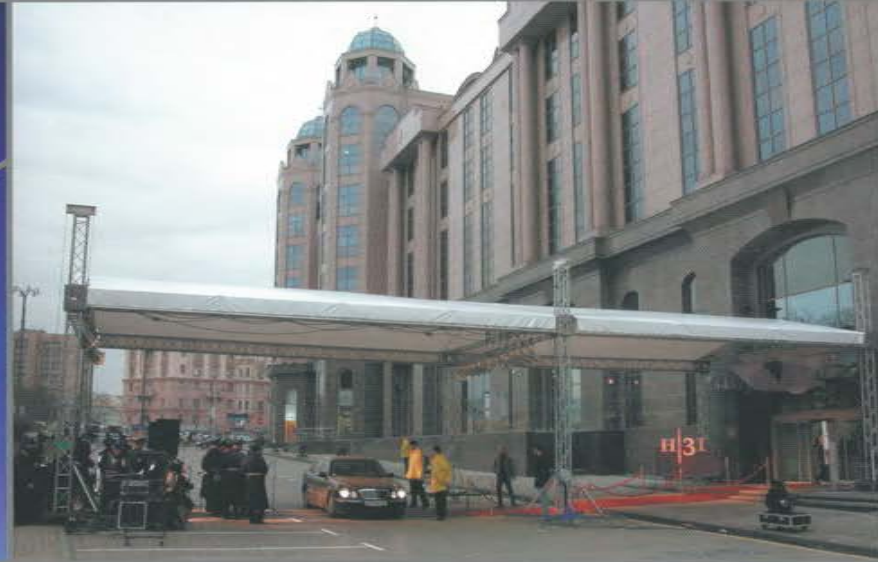
Декоративный навес для церемонии открытия. Офисно-торговый центр «Новинский, 31».