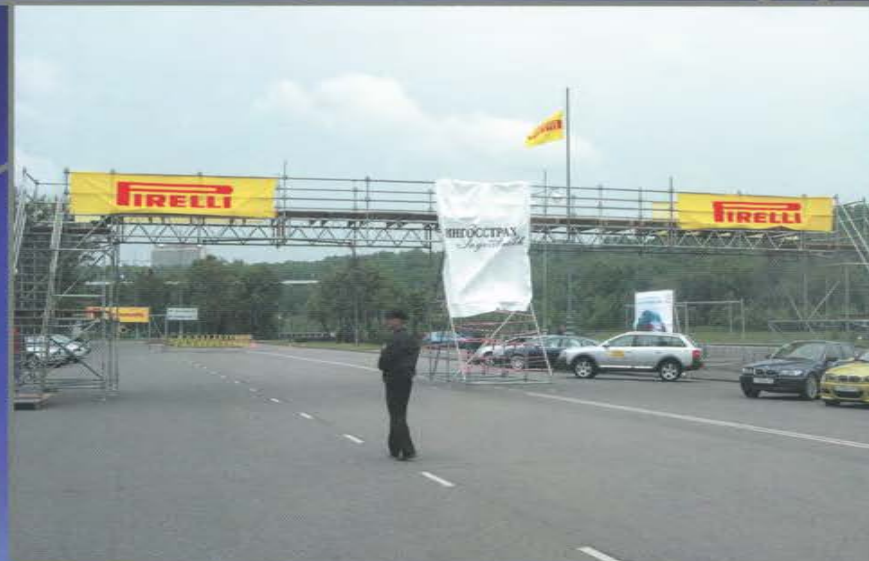
Пешеходный мост над трассой для зрителей. Тест-заезд. Лужнецкая набережная.