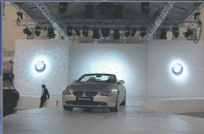
Торжественный прием компаний BMW и Escada. Площадь Государственного Академического Большого Театра.