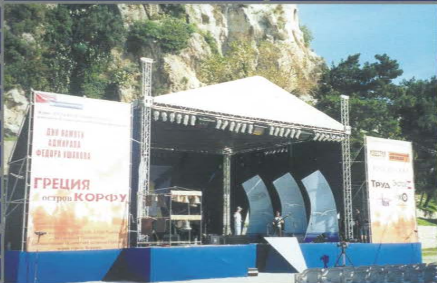
Акция «День памяти адмирала Федора Ушакова». Остров Корфу. Греция.