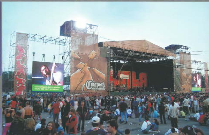
Ежегодный фестиваль «Крылья». Лужники. Южное спортивное ядро.