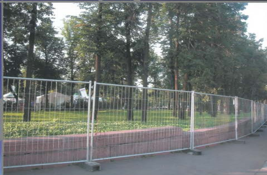
Быстровозводимые легкие заборы ограждения территории для проведения массовых мероприятий.