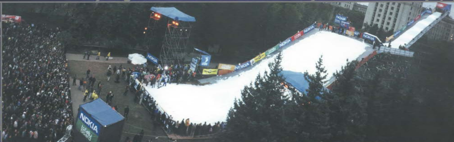
Международный фестиваль Nokia Totally Snowboard. Трамплин длиной 75 м и высотой 35 м. МГУ. Воробьевы горы.