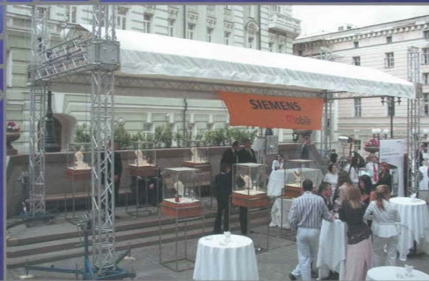
Декоративный навес. VIP-приём на открытом воздухе.