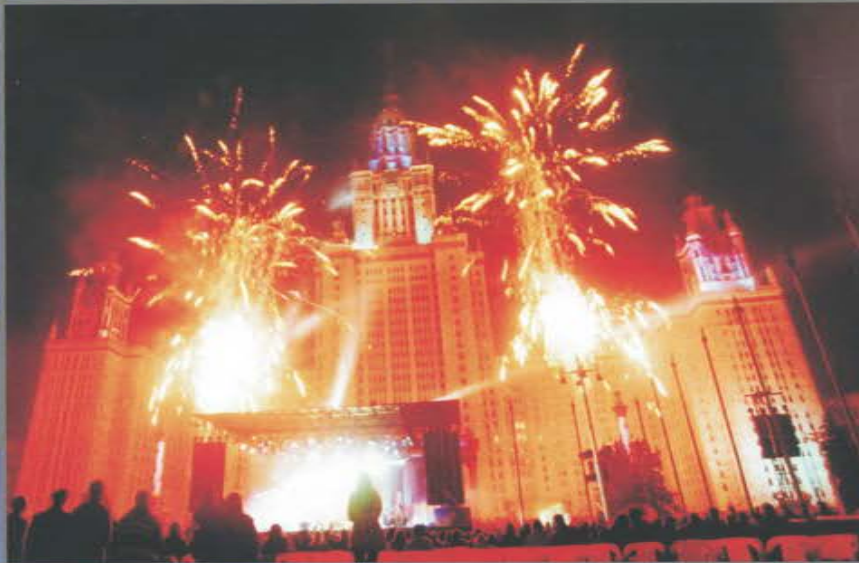
Концерт Жана Мишеля Жарра (Jean Michel Jarre) «Oxygen Moscow». Празднование 850-летия Москвы. МГУ. Воробьевы горы.