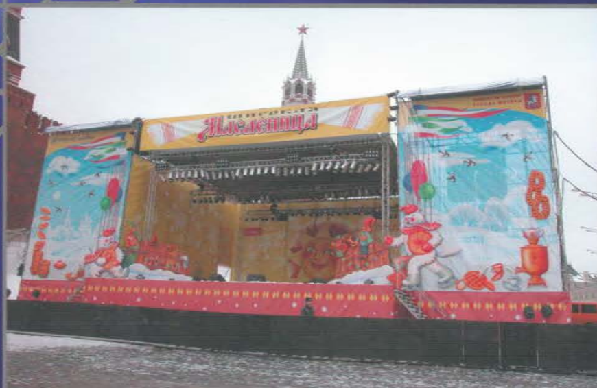
Акция «Празднование Широкой Масленицы». Васильевский спуск. Красная площадь.