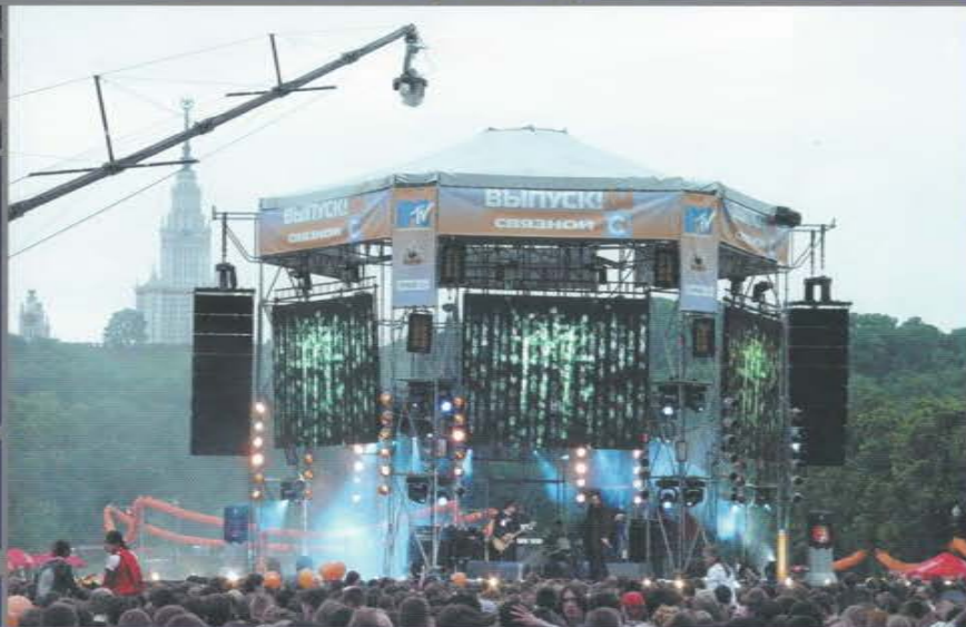
Рекламная акция - концерт компании «Связной». Лужники.