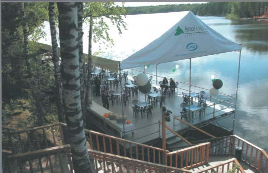
Павильон 29 x 8 м. Вместимость более 300 человек. Установлен в воде на летний период. Дачные отели «Истра Holiday».