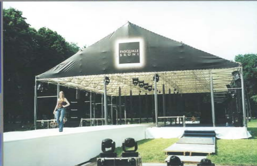
Павильон размером 24 x 40 м. Частное мероприятие. Усадьба Кусково.