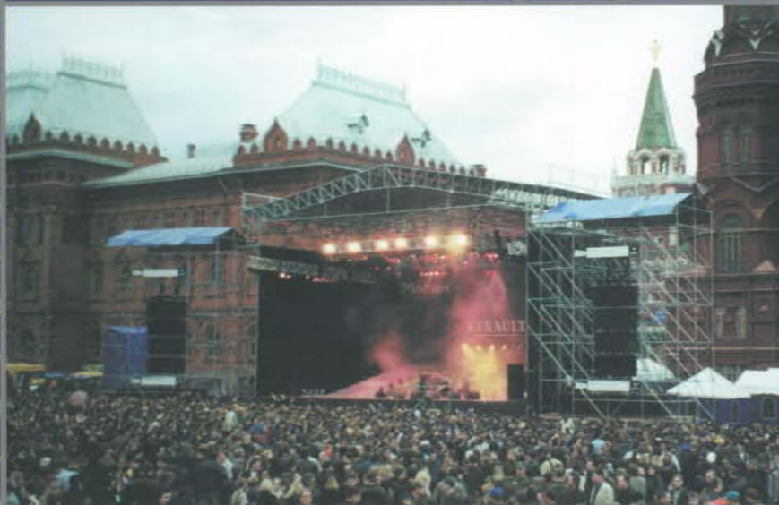
Концерт-презентация автомобиля «Renault Megane». Манежная площадь.