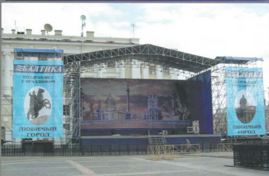
Концерт, посвященный Дню города. Дворцовая площадь. Санкт-Петербург.