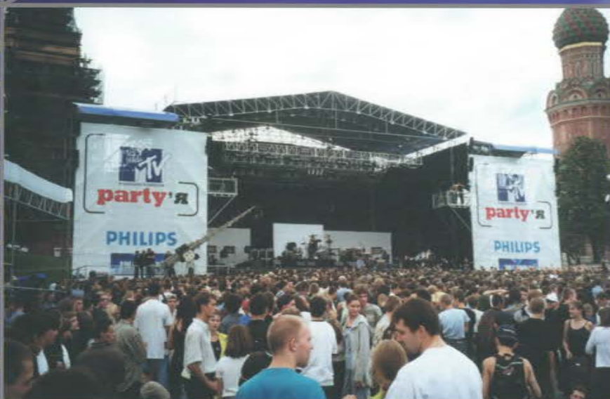
Концерт-акция «MTV party'я» с участием Red Hot Chili Peppers. Васильевский спуск. Красная площадь.