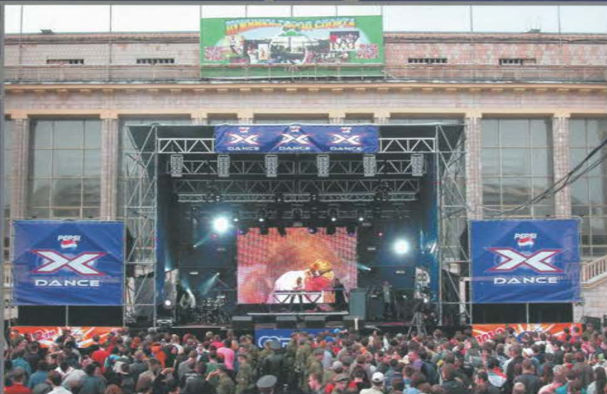
Танцевальная акция «Pepsi X Dance». Сцена с порталами. Лужники.