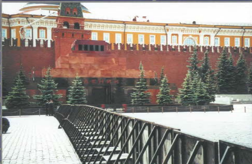
Барьеры безопасности для зрителей при проведении массовых мероприятий.