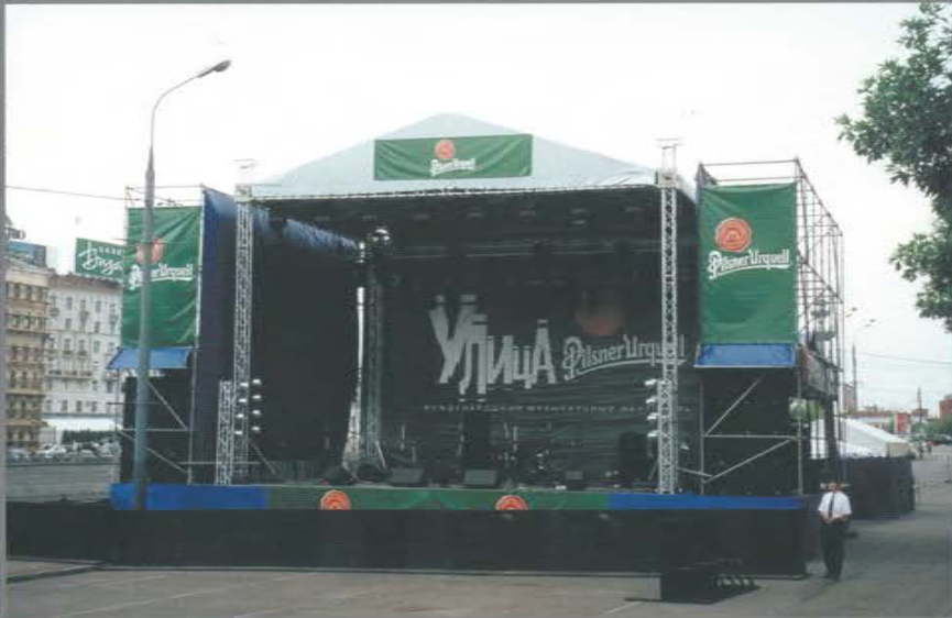
Международный фестиваль уличных музыкантов «Улица Pilsner Urquell». Болотная площадь.