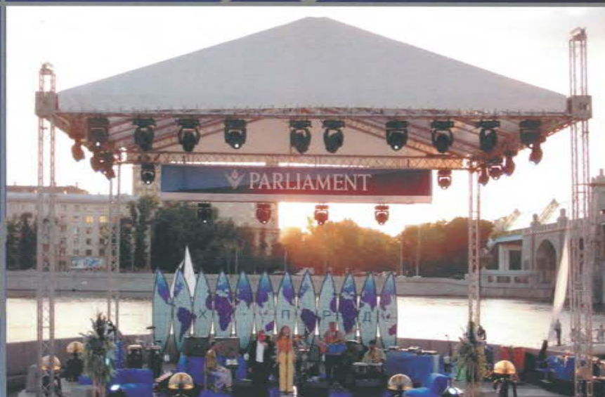
Рекламная акция «Яхт-парад». Пушкинская набережная.