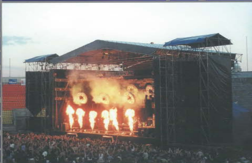
Концерт Rammstein «Mutter». Стадион «Петровский». Санкт-Петербург.