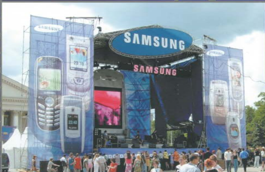
Рекламный тур Samsung. Краснодар, Волгоград, Самара, Новосибирск, Екатеринбург, Нижний Новгород.