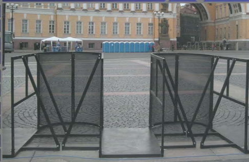
Контрольно-пропускные пункты для безопасного прохода зрителей на массовые мероприятия.