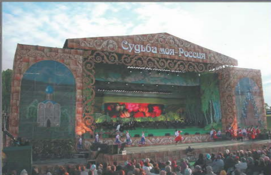
Концерт Людмилы Зыкиной «Судьба моя - Россия». Музей-усадьба «Коломенское».