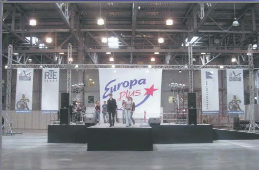
Московский фестиваль-выставка «Мотор-Парк». ВЦ Крокус Экспо.