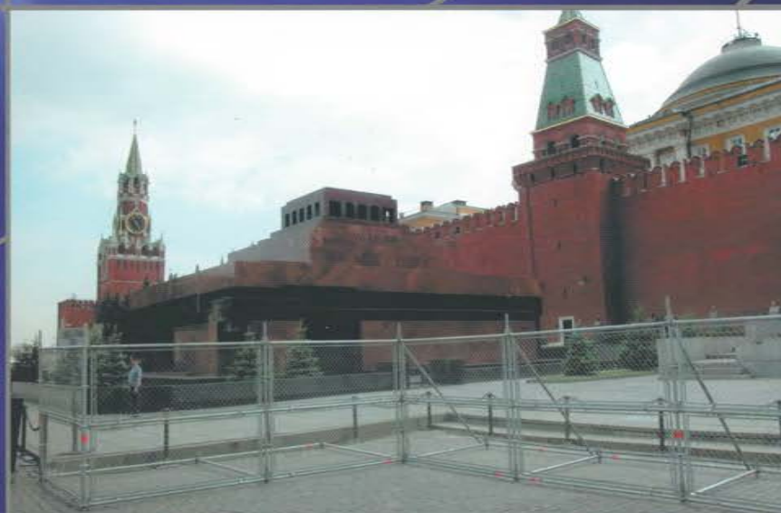
Декоративные заборы ограждения территории для проведения массовых мероприятий.