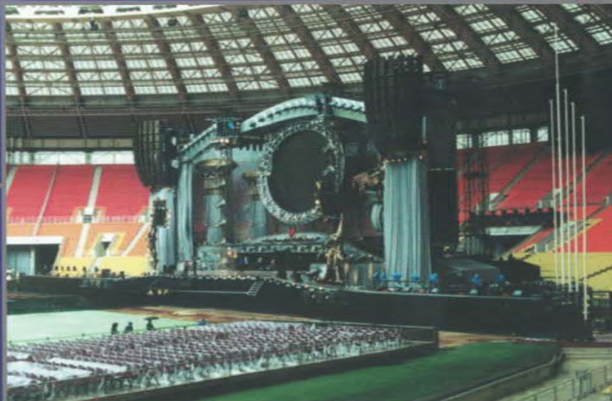
Концерт The Rolling Stones «Bridges To Babylon» . БСА Лужники.