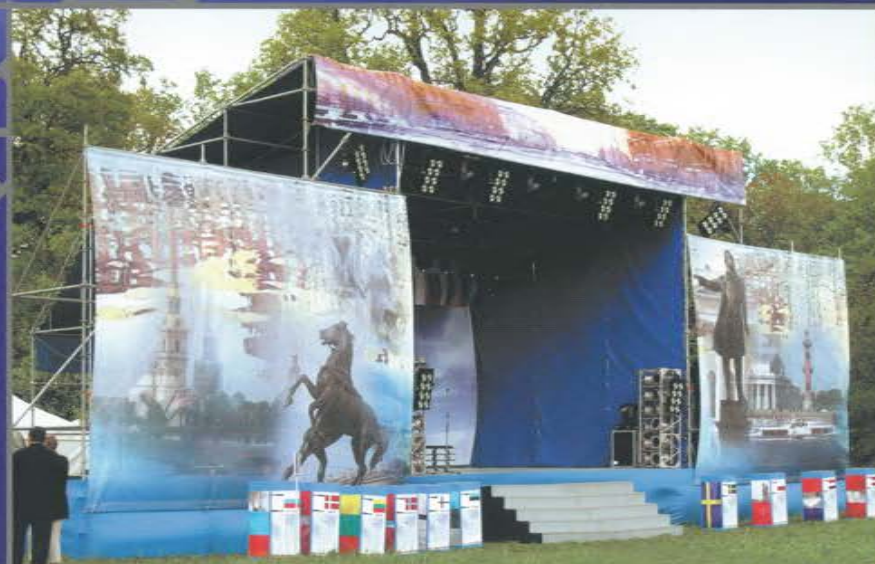
Концертная площадка в рамках празднования дня города. Санкт-Петербург. Елагин остров.