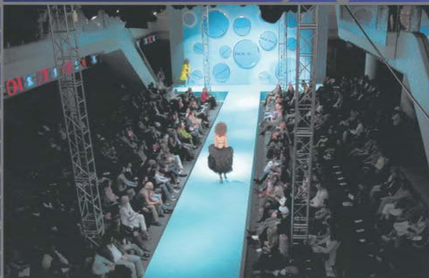
Презентация и модельный показ Vouton. Офисно-торговый центр «Новинский, 31».