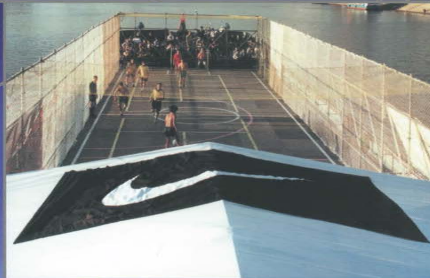
Рекламная акция компании Nike. Организация площадки на барже для спортивных соревнований.