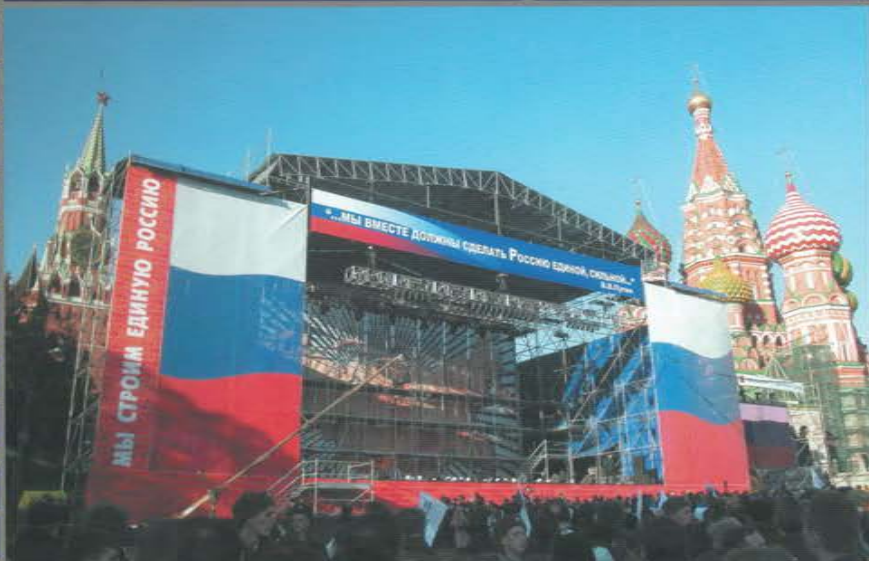
Концерт, посвященный Дню Согласия и примирения. Васильевский спуск. Красная площадь.