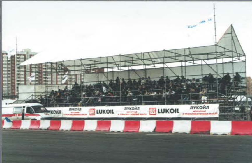
Трибуна для зрителей на автогонках. Ходынкское поле.