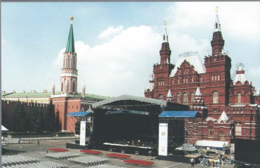
Благотворительный концерт Пласидо Доминго (Placido Domingo). Красная площадь.