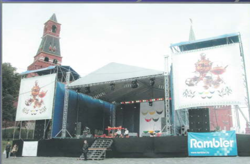
Концертная акция в рамках празднования Дня города. Васильевский спуск. Красная площадь.