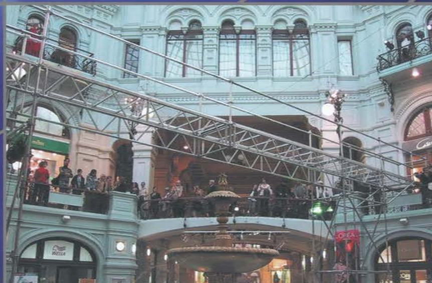
Конструкция подвесного прозрачного подиума. Модельный показ. Торговый дом «ГУМ».